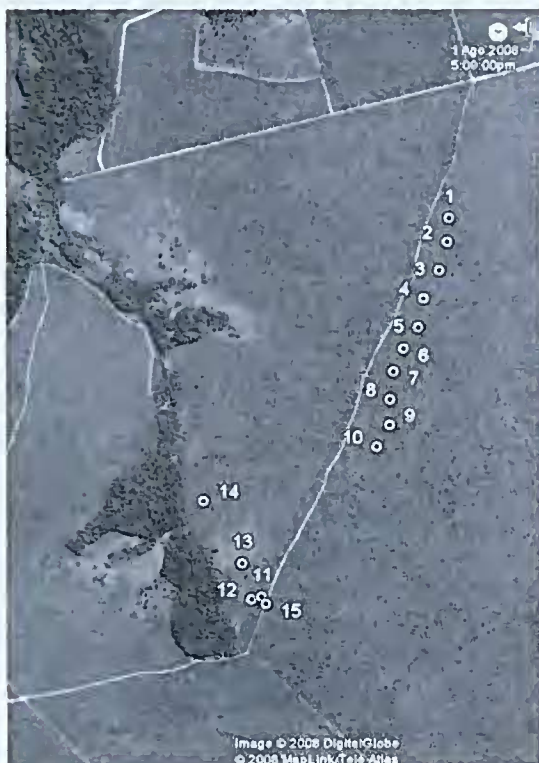
Figura 2 – Parcelas estabelecidas na Estação Ecológica do Jardim Botânico de Brasília. 1–10 no interflúvio, 750–1500 m distantes da borda da mata e 11–15 no vale 70–150 m distantes da borda da mata de galeria do córrego Cabeça-de-Veado. Imagem: www.earth.google.com .

Em 2000, para o presente trabalho, a vegetação foi reavaliada, três anos após a primeira amostragem, em 10 parcelas na área I e em apenas cinco parcelas na área V, porque as outras cinco foram perdidas. Das 15 parcelas remanescentes, 10 na área do interflúvio (I) ocorrem sobre Latossolo Vermelho-Escuro e distam da borda da mata de galeria entre cerca de 750 m, parcela 5 e 1500 m parcela 1. No vale (V), as parcelas ocorrem sobre Cambissolos e distam da borda da mata de galeria entre cerca de 70 m, parcela 14 e 150 m parcela 15. As áreas I e V estão separadas por via que permite acesso a EEJBB (Fig. 2).